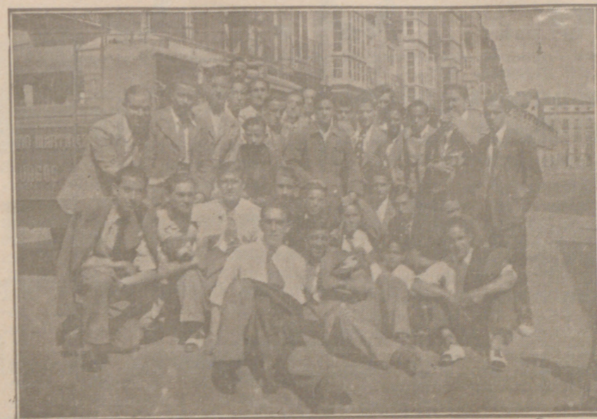
Desplazamiento del equipo «Juventud F. C.» a Briviesca