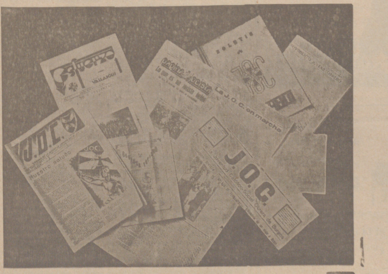
Prensa jocista española