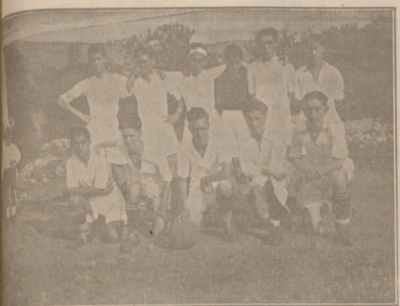
El primer equipo «Juventud F. C.»