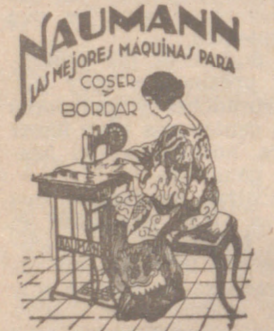
Máquina coser NAUMANN. Bobina central. Precios más baratos que nadie.