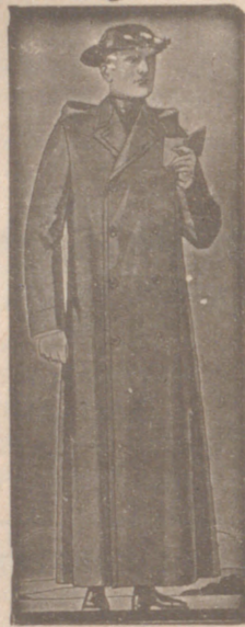
Guardapolvos de dril. a 20, 22 y 25 pesetas.