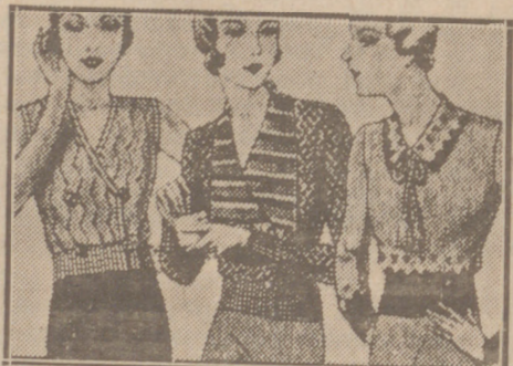
Blusas punto novedad a 5, 6, 8, 10 y 12 ptas.