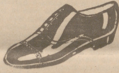
Zapatos los mejores, 18 ptas.