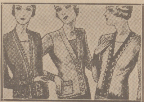
Blusas choquelitas de 7, 8, 10, 12 y 15 ptas.