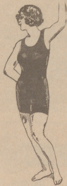
Trajes de baño en algodón o lana de 5,50, 4, 5, 6, 10, 12 y 15 ptas