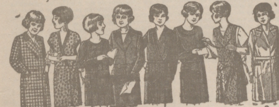
20 modelos distintos en vestidos para niñas. En percal, de 6 a 10 años, de 4 a 6 años. En trivalcos, de 6 a 10 años, de 5 a 7 años. En crepones seda, de 6 a 10 años, de 10 a 20 años.

Primera casa en confecciones para caballero, señora, jóvenes y niños. — Tejidos, Pañería y Sasería.