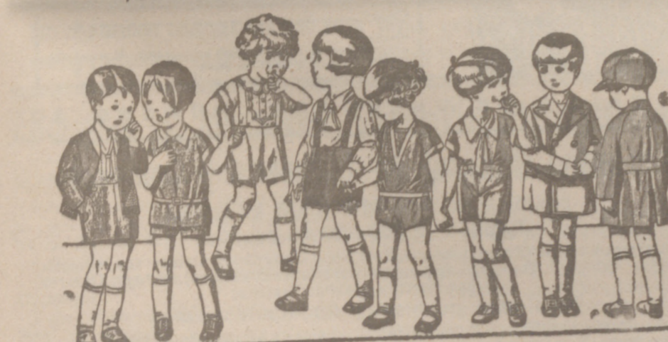
Diversidad de modelos entre en trapecitos para niños en punto, drill, lana, o pana, de 8 a 15 años.

TARIFAS Hasta 15 palabras 0'50 pias. Inscrpción. Cada chico palabras o fracción más, 0'15 pias. Bolsa provincial de trabajo, GRATIS.