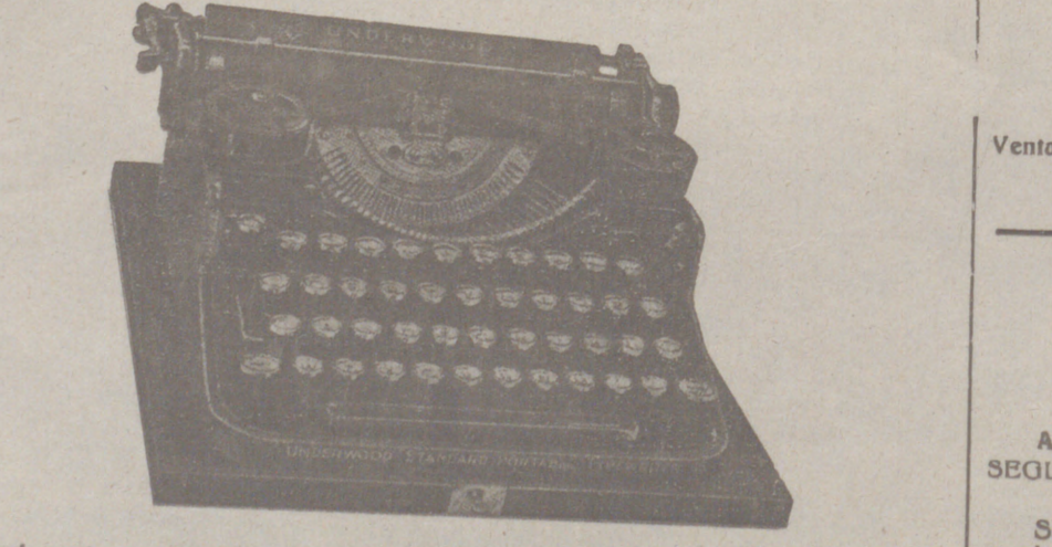
Máquinas de escribir de viaje «Underwood». Precio: 750 pesetas. Último modelo. Máquinas «Underwood» oficina n.º 8, 8/12 y 8/14. Precios como nadie. Antes de hacer su compra de máquinas vea éstas y sus precios, con garantía de 6 años. Alquiler de máquinas de escribir. Ficheros. Multicopistas. Papel carbón. Papel cera. Cintas para máquinas precio fábrica