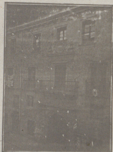
Entrada a las Oficinas de la Federación y MUTUALIDAD AGRÍCOLA BURGALESA. Calle de Santander, números 10, 12 y 14, Burgos.

Un accidente en vuestros obreros, criados, pastores o en vosotros mismos, puede causar grave daño económico o la ruina en vuestra casa.