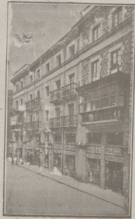
Fachada, por la calle de la Moneda números 10 y 17, de la CASA SOCIAL propiedad de la Federación Burgalesa de Sindicatos Agrícolas Católicos.

Se hallan establecidas en su planta baja las Oficinas y talleres de máquinas de «El Castellano» y «El Defensor de los Labradores»