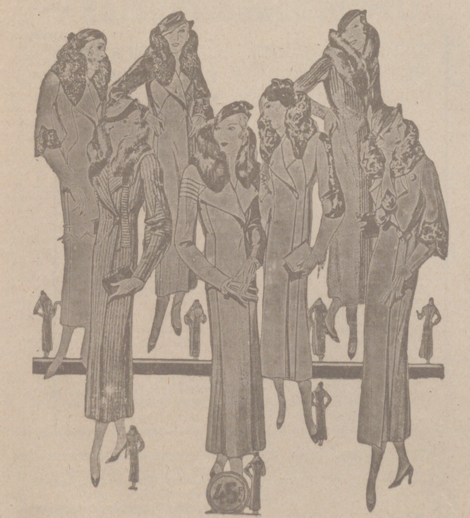
80 Modelos distintos en Abrigos Gamuzas NOVEDAD. — Modelos, creación Parísien a 25, 30, 40, 50, 60, 70, 80 y 100 pesetas