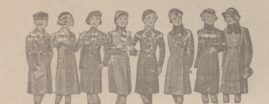
ABRIGOS PARA NIÑAS — MODELOS NOVEDAD, de 15, 18, 20, 25, 30 y 40 pesetas.