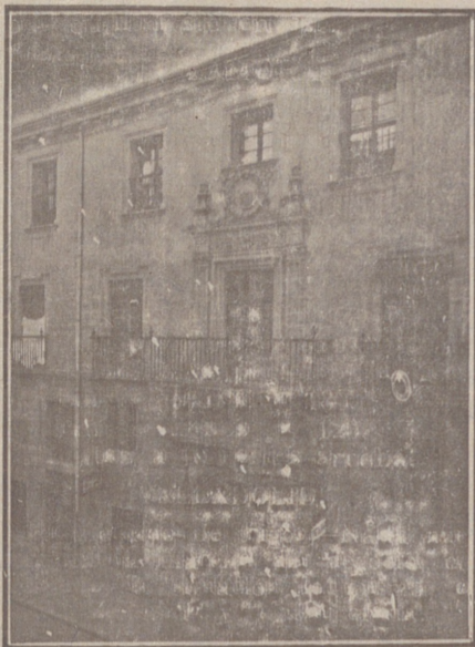
Entrada a las Oficinas de la Federación y MUTUALIDAD AGRÍCOLA BURGALESA. Calle de Santander, números 10, 12 y 14. Burgos.

En ella están las Oficinas de la FEDERACIÓN, CAJA DE AHORROS, MUTUALIDAD AGRÍCOLA BURGALESA y Redacción y Administración de «El Castellano» y «El Defensor de los Labradores»