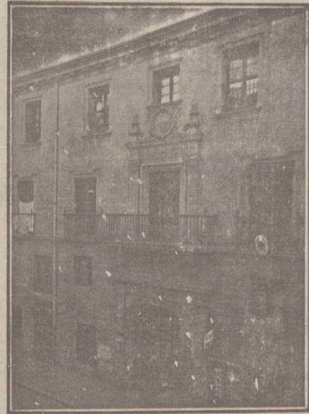
Entrada a las Oficinas de la Federación y MUTUALIDAD AGRÍCOLA BURGALESA. Calle de Santander, números 10, 12 y 14, Burgos.

Un accidente en vuestros obreros, criados, pastores o en vosotros mismos, puede causar grave daño económico o la ruina en vuestra casa.