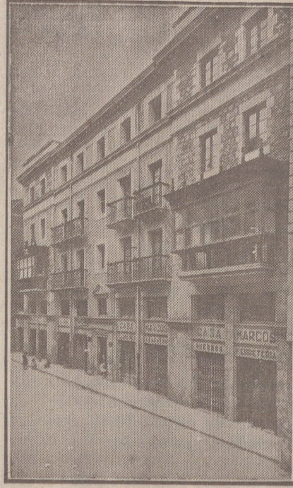
Fachada, por la calle de la Moneda, números 15 y 17, de la CASA SOCIAL propiedad de la Federación Burgalesa de Sindicatos Agrícolas Católicos.

Se hallan establecidas en su planta baja las Oficinas y talleres de máquinas de «El Castellano» y «El Defensor de los Labradores»