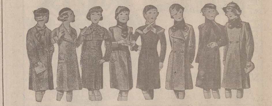
ABRIGOS PARA NIÑAS — MODELOS NOVEDAD, de 15, 18, 20, 25, 30 y 40 pesetas.

Primera casa en confecciones para caballero, señora, jóvenes y niños. — Tejidos, Pañería y Sastrería.