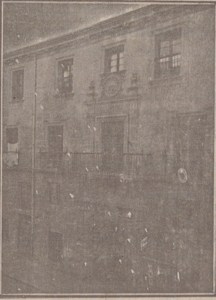
Entrada a las Oficinas de la Federación y MUTUALIDAD AGRÍCOLA BURGALESA. Calle de Santander, números 10, 12 y 14, Burgos.