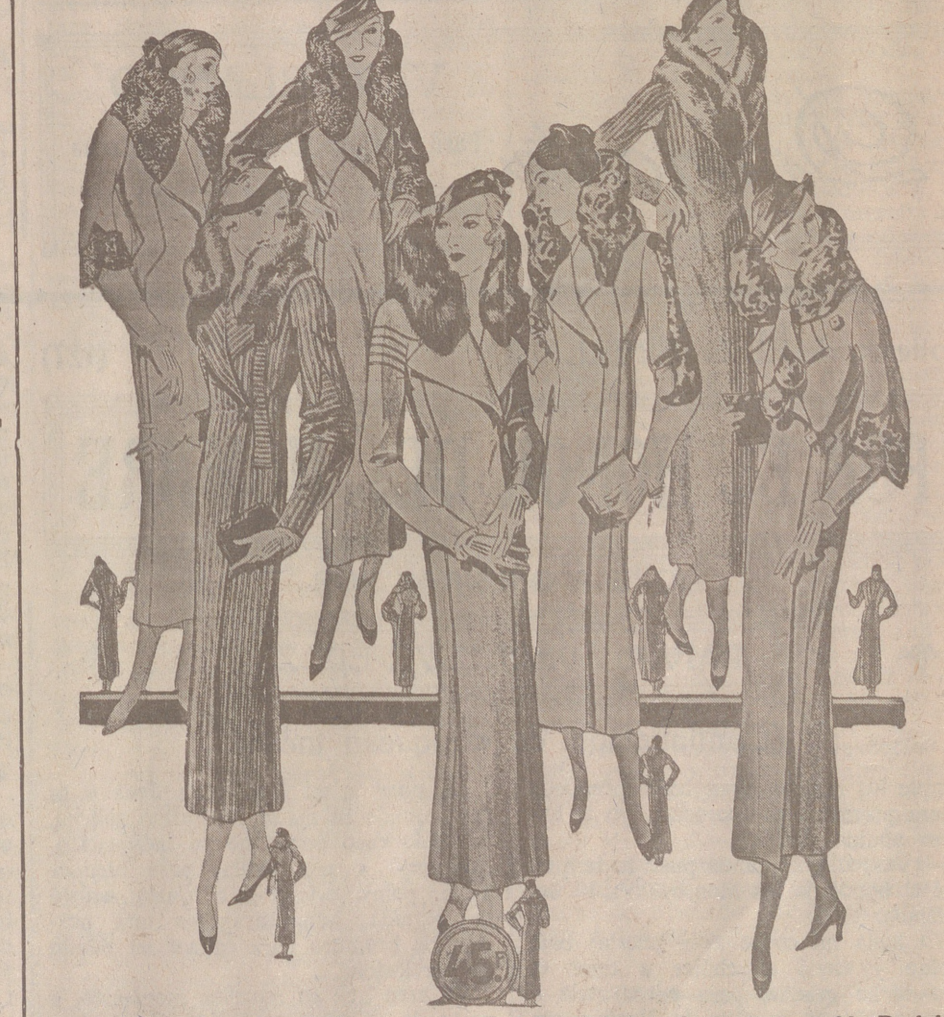
50 Modelos distintos en Abrigos Gamuzas NOVEDAD.—Modelos, creación Parísien a 25, 30, 40, 50, 60 70, 80 y 100 pesetas