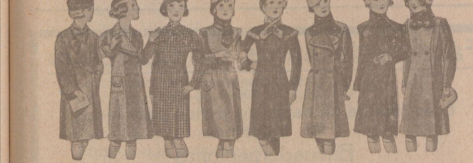
ABRIGOS PARA NIÑAS — MODELOS NOVEDAD, de 15, 18, 20, 25, 30 y 40 pesetas.

Primera casa en confecciones para caballero, señora, jóvenes y niños. — Tejidos, Pañería y Sastrefía.