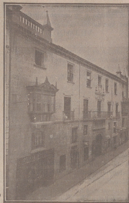
Fachada, por la calle de Santander, 10, 12 y 14, de la CASA SOCIAL propiedad de la Federación Burgalesa de Sindicatos Agrícolas Católicos.

Oficinas: (Casa de la Federación): Calle de Santander, 10 y 12 Burgos