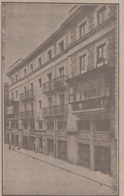
Fachada, por la calle de la Moneda, números 15 y 17, de la CASA SOCIAL propiedad de la Federación Burgalesa de Sindicatos Agrícolas Católicos.

Se hallan establecidas en su planta baja las Oficinas y talleres de máquinas de «El Castellano» y «El Defensor de los Labradores»