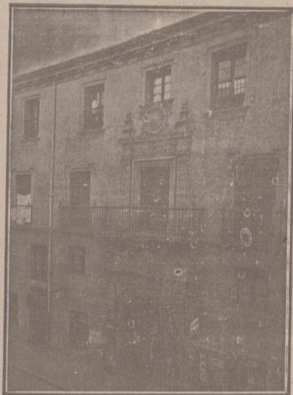
Entrada a las Oficinas de la Federación y MUTUALIDAD AGRÍCOLA BURGALESA Calle de Santander, números 10, 12 y 14 Burgos

Un accidente en vuestros obreros, criados, pastores o en vosotros mismos, puede causar grave daño económico o la ruina en vuestra casa.