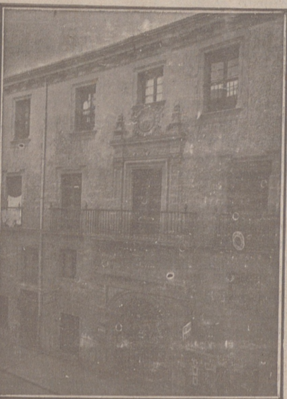
Entrada a las Oficinas de la Federación y MUTUALIDAD AGRÍCOLA BURGALESA Calle de Santander, números 10, 12 y 14 Burgos