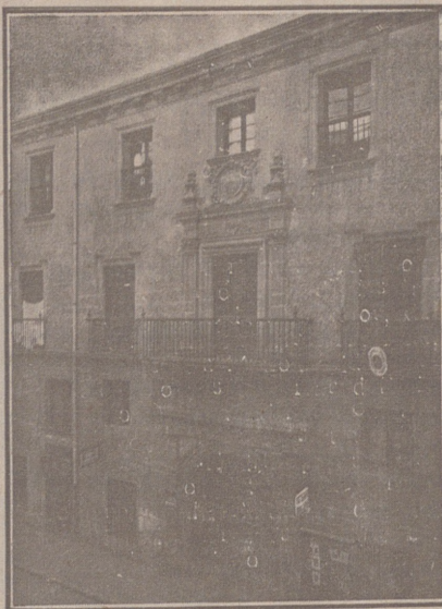
Entrada a las Oficinas de la Federación y MUTUALIDAD AGRÍCOLA BURGALESA Calle de Santander, números 10, 12 y 14 Burgos

Un accidente en vuestros obreros, criados, pastores o en vosotros mismos, puede causar grave daño económico o la ruina en vuestra casa.