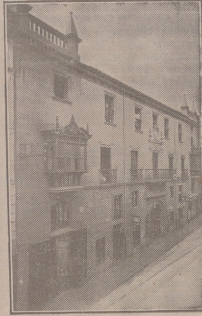
Fachada, por la calle de Santander, 10, 12 y 14, de la CASA SOCIAL propiedad de la Federación burgalesa de Sindicatos Agrícolas Católicos.

En ella están las Oficinas de la FEDERACIÓN, CAJA DE AHORROS, MUTUALIDAD AGRÍCOLA BURGALESA y Redacción y administración de «El Castellano» y «El Defensor de los Labradores».