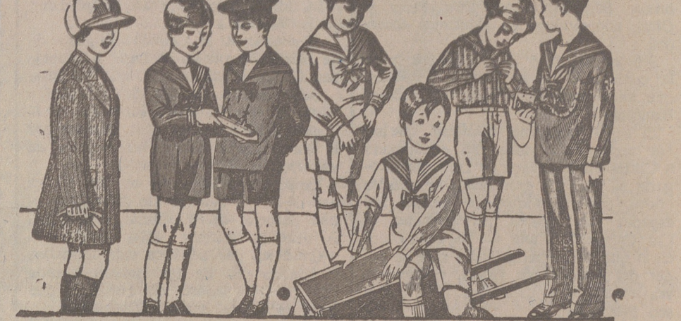
50 modelos distintos en trajes para niños en dril, en pana, en paño y en jergas azules, de 10 a 40 pesetas.

Primera casa en confecciones para caballero, señora, jóvenes y niños. — Tejidos, Pañería y Sastrería.