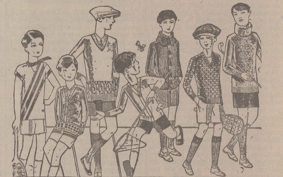
Jerseys para niños, dibujos novedad, desde 4, 4,5 5, 6, 7, 8, 10 y 12 ptas. Siempre gran surtido para elegir