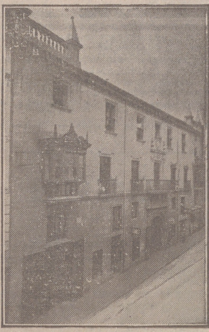
Fachada, por la calle de Santander, 10, 12 y 14, de la CASA SOCIAL propiedad de la Federación burgalesa de Sindicatos Agrícolas Católicos.

En ella están las Oficinas de la FEDERACIÓN, CAJA DE AHORROS, MUTUALIDAD AGRÍCOLA BURGALESA y Redacción y administración de «El Castellano» y «El Defensor de los Labradores».