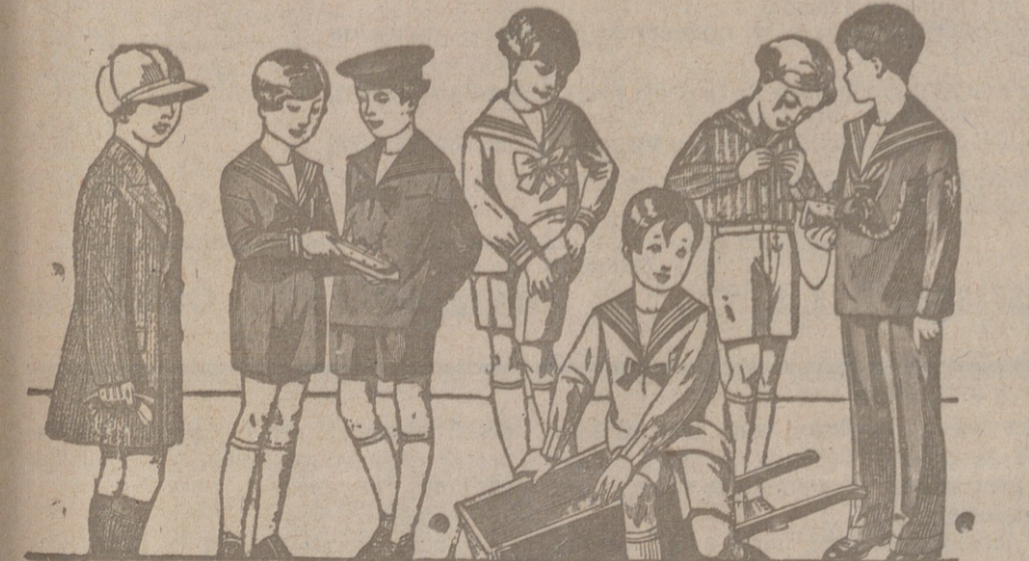
50 modelos distintos en trajes para niños en drill, en pana, en paño y en sergas azules, de 10 a 40 pesetas.

Primera casa en confecciones para caballero, señora, jóvenes y niños. — Tejidos, Pañería y Sastrefía.