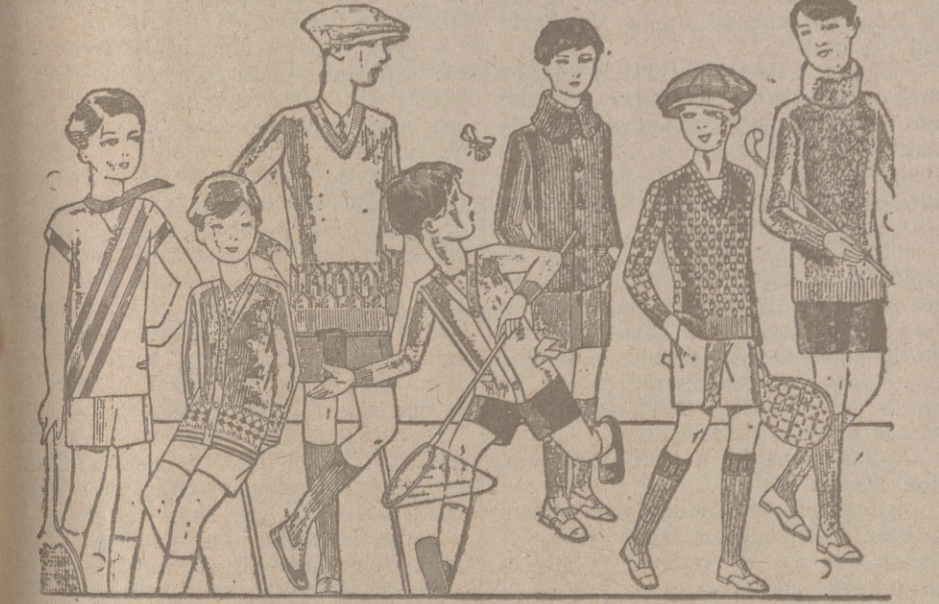
Jerseys para niños, dibujos novedad, desde 4, 4,50 5, 6, 7, 8, 10 y 12 ptas. Siempre gran surtido para elegir