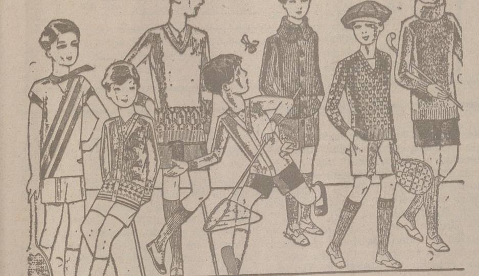
Jerseys para niños, dibujos novedad, desde 4, 4,50 5, 6, 7, 8, 10 y 12 pias. Siempre gran surtido para elegir