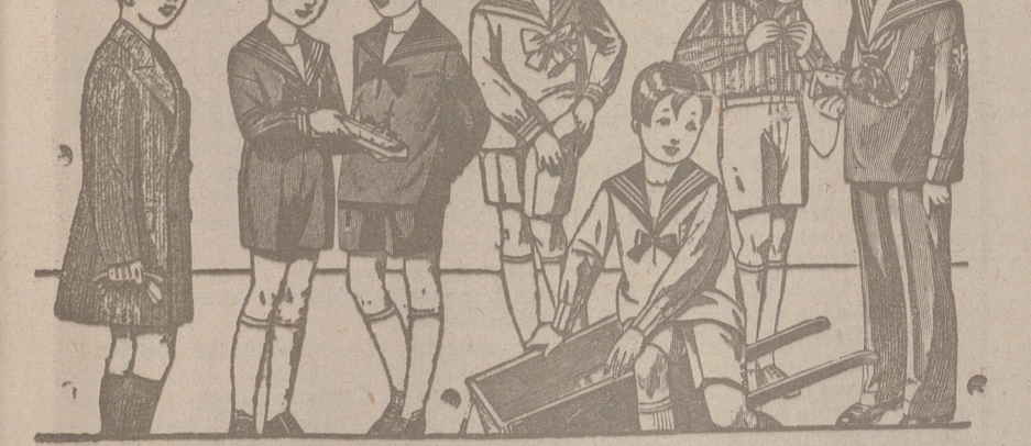
50 modelos distintos en trajes para niños en dril, en pana, en paño y en fergas azules, de 10 a 40 pesetas.

Plaza Mayor 42 y Lala Calvo 7 Sucursal: Plaza Mayor, 5 BURGOS Primera casa en confecciones para caballero, señora, jóvenes y niños. — Tejidos, Pañería y Sastrería.