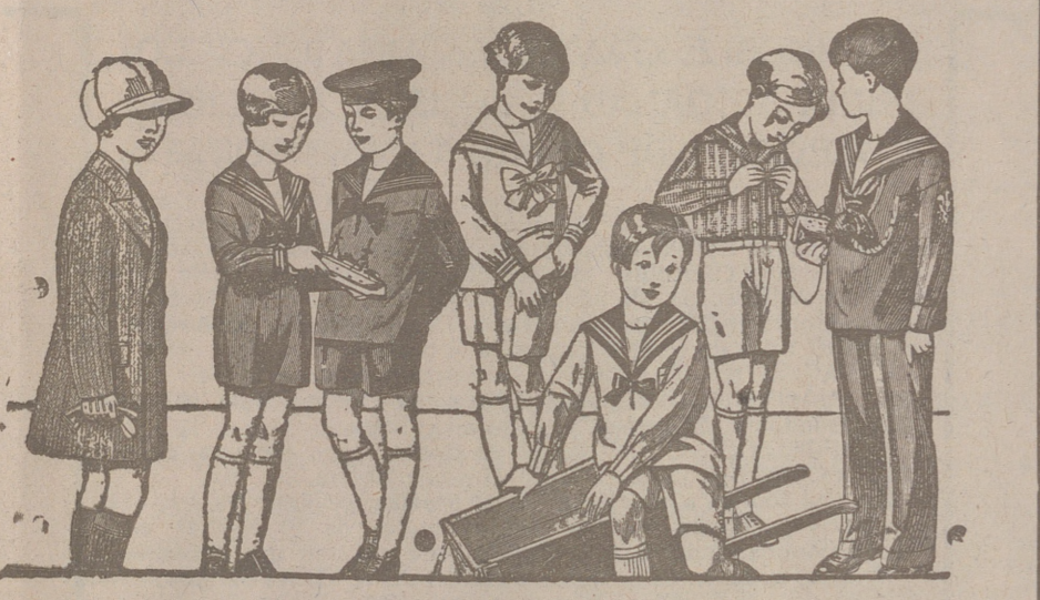
50 modelos distintos en trajectos para niños en drill, en pana, en pañol y en jergas azules, de 10 a 40 pesetas.

Plaza Mayor 42 y Lain Calvo 7 Primera casa en confecciones para caballero, señora, jóvenes y niños.