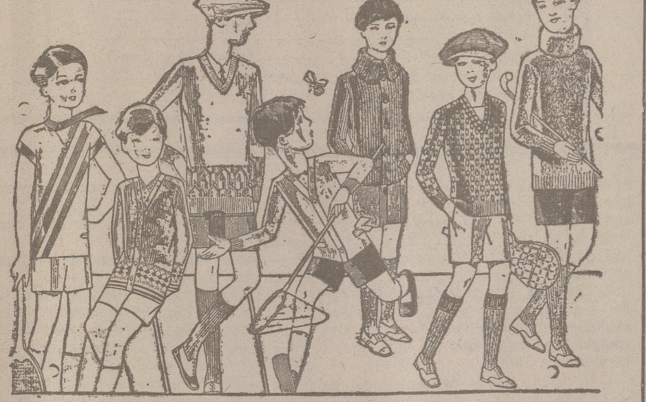
Jerseys para niños, dibujos novedad, desde 4, 4,50 5, 6, 7, 8, 10 y 12 ptas. Siempre gran surtido para elegir