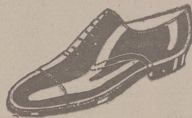
Zapatos piel de 1.ª, del 58 al 45, a 18 ptas. Zapato charol, a 19'50. LIMPIEZA GRATIS