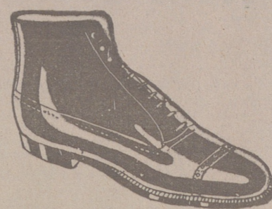
Botas clase 1.ª «Segarra», a 19'50. pesetas. Piel de hierro, a 19'50. Piel de hierro piso goma, a 18 ptas.