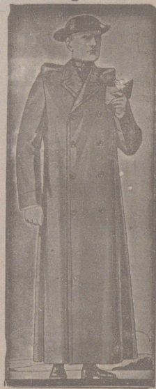
Impermeables, de 90, 100 y 115 ptas. Guardapolvos de dril forma dulteta, a 18, 20 y 50 ptas.