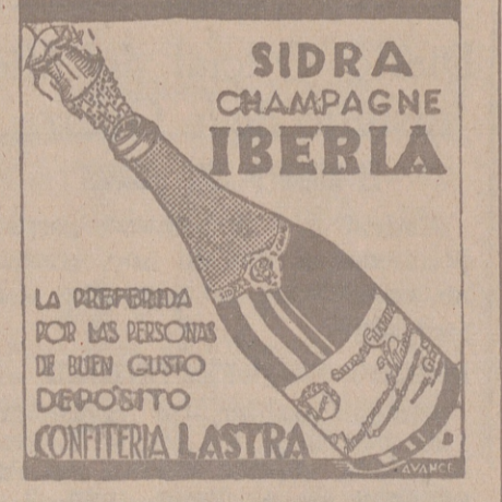
Botella, 1'85 ptas.

Fue rechazada una proposición del representante progresista, en la que se pedía la publicación de un manifiesto haciendo saber al país que el Gobierno es el único responsable de la crítica situación actual.