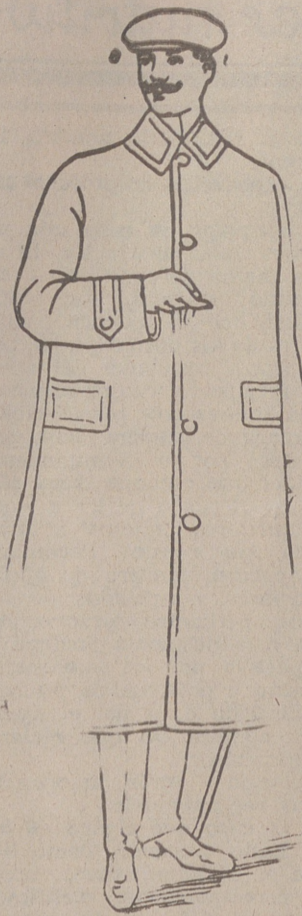
Gabardinas cuello cerrado o solapas, a 50, 55, 40 y 50 pesetas. De lana, a 60, 70 y 90 ptas.

Casa Munguía :: Plaza Mayor 42 y Lala Calvo 9 Sucursal: Plaza Mayor, 5 BURGOS Primera casa en confecciones para caballero, señora, jóvenes y niños. — Tejidos, Pañería y Sastrería.