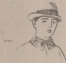
Pellicas de paño, a 20, 25, 50, 40, 50, 60, 70, 80 y 100 pesetas.