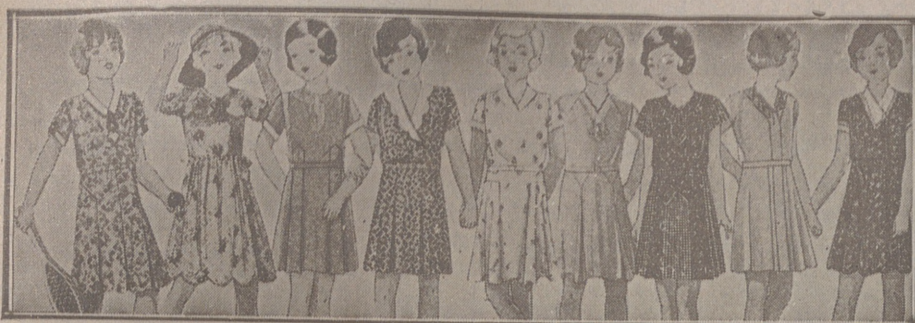
Vestidos de percal, batistas, crespones y lanas, edades de 4 a 8 años, a 8, 5,50, 4, 5, 6, 7 y 8 pts. Modelos novedad.

Casa Manguía :: Plaza Mayor 42 y Lala Calvo 9 Sucursal: Plaza Mayor, 5 BURGOS Primera casa en confecciones para caballero, señora, jóvenes y niños. — Tejidos, Pañería y Sastrefía.