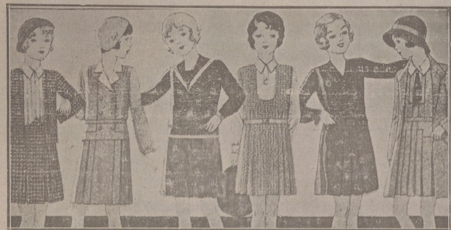
Vestidos para niñas, edad de 8 a 15 años, de crespones, lanas, batistas o percales, dibujos y colores novedad, a 6, 8, 10, 12 y 15 pesetas.