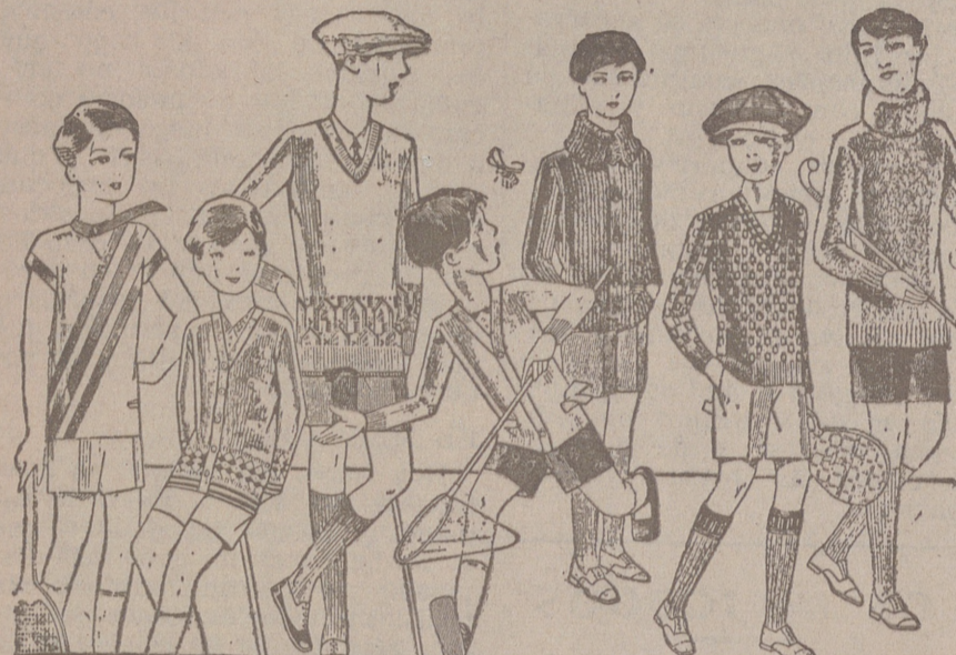
Jerseys para niños, dibujos novedad, desde 4, 4,50, 5, 6, 7, 8, 10 y 12 pts. Siempre gran surtido para elegir.