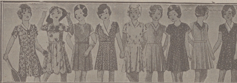
Vestiditos niñas edad de 5 a 10 años, en lana, crispón o punto a 10, 12, 15, 16, 18 y 20 pesetas.