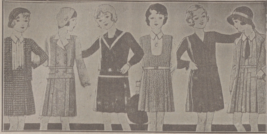
Vestiditos de lana, crispón seda y punto lana, edad de 8 a 14 años, a 14, 16, 18, 20 y 25 pesetas.

Primera casa en confecciones para caballero, señora, jóvenes y niños. — Tejidos, Pañería y Sastería.