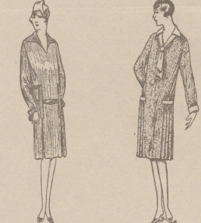
Vestidos de CRESPON o LANA de 18 a 55 pesetas. CORTE MODERNO. Baños PERCAL. SATÉN NEGRO o CEFIRO desde 7 a 15 pesetas. MODELOS BONITOS

Plaza Mayor, 42 Lata-Calvo, 9 y 11 BURGOS Teléfono 603-R Primera casa en confecciones para caballero, señora y niños.