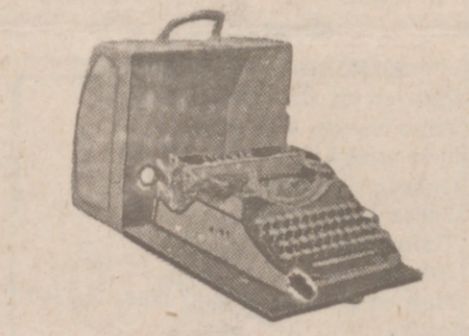
Máquinas de escribir Estuche, Marca STOEWER, a 600 ptas.