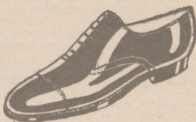
Zapatos en cinco colores distintos a 18 pesetas Zapato Charol, a 19'80

CALZADOS SEGARRA TODO COSIDO GOODYEAR Venta directa del Fabricante al consumidor