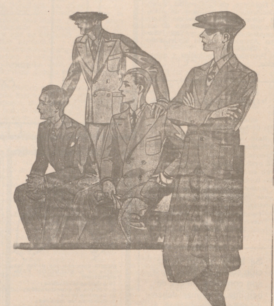
Trajes para jovencitos, edad de 10 a 20 años, a 40, 45, 50, 60, y 70 pesetas

Casa Munguía Plaza Mayor, 42 Lain-Calvo, 9 y 11 BURGOS