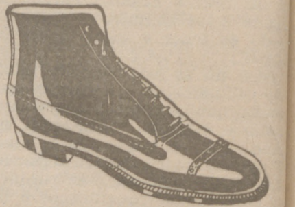
Botas en negro y color todo cosido a 19'50 pesetas EXPOSICION Y VENTA

Casa Munguía PLAZA MAYOR, 42 LAIN CALVO 9 Y 11 BURGOS