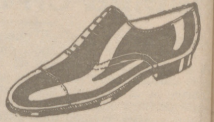
Zapatos en cinco colores distintos a 18 pesetas Zapato Charol, a 19'50

CALZADOS SEGARRA TODO COSIDO GOODYEAR Venta directa del Fabricante al consumidor