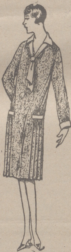
Vestidos de crepón, seda y en lana, colores novedad, a 20, 25, 30 y 40 ptas