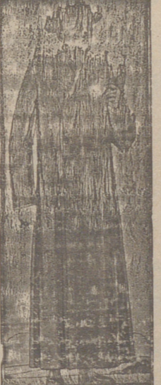
DULLETAS IMPERMEABLES a 95, 110 y 115 pesetas.

Casa Munguía PLAZA MAYOR, 42 BURGOS LAIN CALVO 9 Y 11