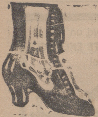
Gran surtido en todas clases, y sección económica a precios de fábrica.

En la Delegación del Comité del Nitrato de Sosa de Chile, Almirante 19, Madrid, se resuelven gratuitamente las consultas relativas a la aplicación de este abono, que se hagan por carta ó verbalmente, y se envían folletos que tratan de la fertilización de los diversos cultivos que pueden interesar al agricultor español.