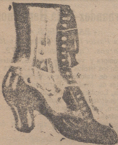
Gran surtido en todas clases, y sección económica a precios de fábrica.

GRAN BAZAR DE CALZADO EMILIANO DOMINGO Mercado, núm. 10.