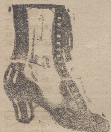
Gran surtido en todas clases y sección económica á precios de Fábrica

En la Delegación del Comité del Nitrato de Sosa de Chile, Almirante 19, Madrid, se resuelven gratuitamente las consultas relativas a la aplicación de este abono, que se hagan por carta ó verbalmente, y se envían folletos que tratan de la fertilización de los diversos cultivos que pueden interesar al agricultor español.