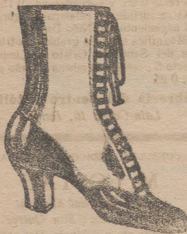
Gran surtido en todas clases, y sección económica á precios de Fábrica.

De venta en las principales farmacias del mundo y en Sorzano, 30, MADRID, desde donde se remiten folletos á quien los pida.