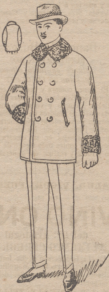
Peliza paño castor con rizo en el cuello y bocamangas, á 30, 40, 45, 50, 60 y 70 pesetas.

Primera casa en confecciones de caballero señora y niño