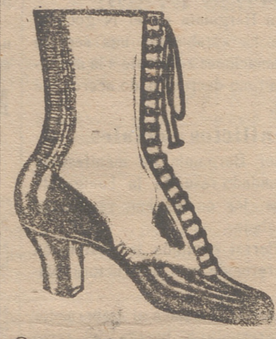
Gran surtido en todas clases, y sección económica a precios de Fábrica.

Sin precisar baños ni pomadas, y sin molestias si se usa el Sulfosal de primera intención que quita la sarna a la primera frotación. Con su uso desaparecen el sarpullido antiguo de la cara, manchas y granulaciones de la piel, procedan o no de enfermedades secretas. Primer antisarnico liquido; seis años de exitos, crecientes y honrosas distinciones otorgadas por eminentes médicos acreditados su bondad para la curación pronta de la sarna y de otras enfermedades de la piel. De venta: en Coruña, señores sucesores de J. Villa, y en Santiago, B. Bermejo, Droguería.