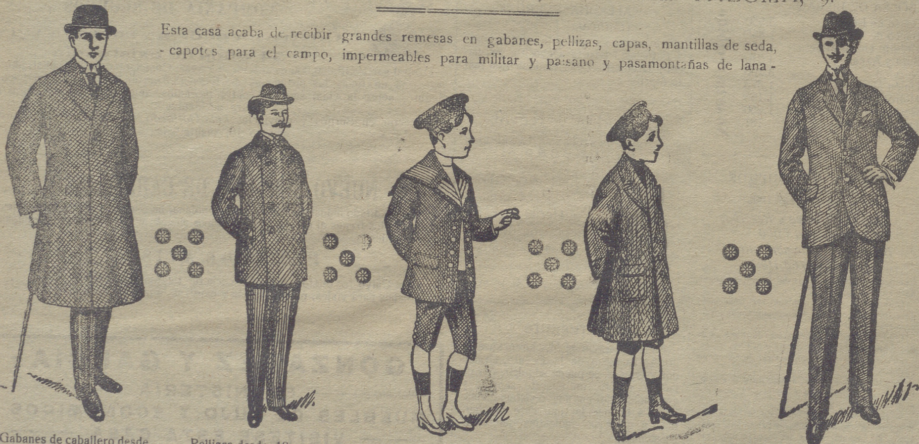
Gabanes de caballero desde 40 pesetas á 125

Esta casa acaba de recibir grandes remesas en gabanes, pelizas, capas, mantillas de seda, capotes para el campo, impermeables para militar y pasano y pasamontañas de lana.