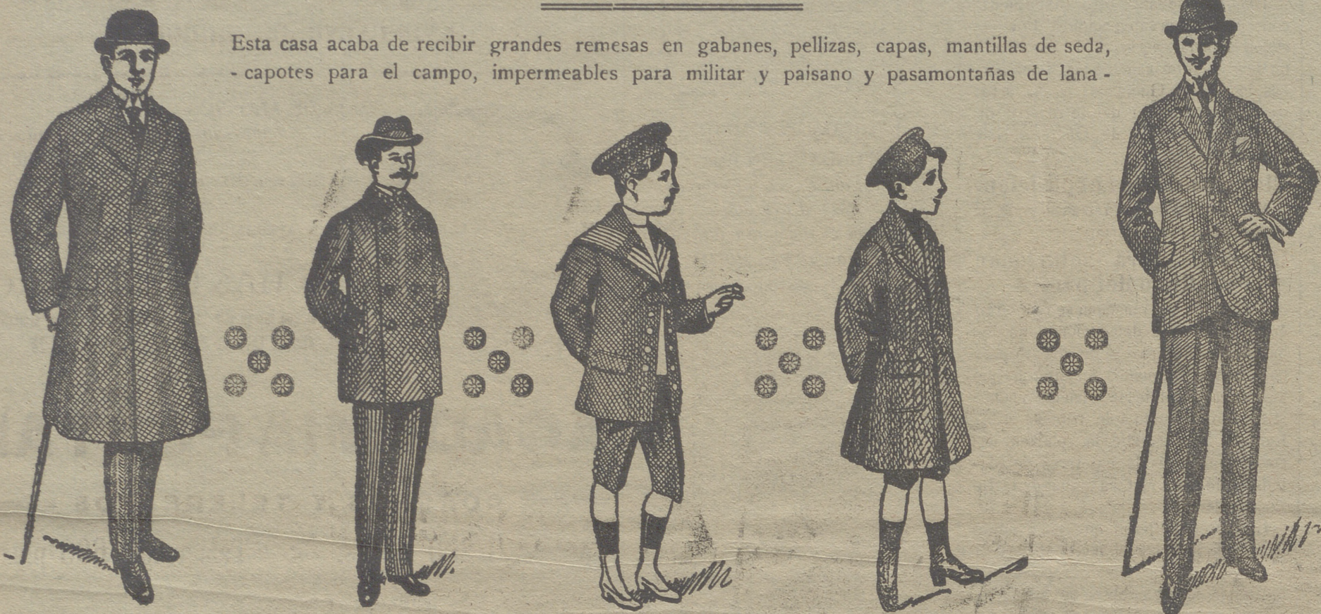
Gabanes de caballero desde 40 pesetas á 125.

PLAZA MAYOR, 42 y LAIN-CALVO, 9. Sucursal: PALOMA, 9.