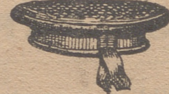
Gorras marineras de Vicuña de 2.50 3 y 3.50.