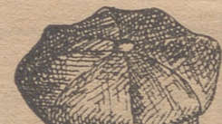
Gorras pana 1.25, 2, 2.50 y 4

Cuellos piqué . . . 0.50 p. id. plancha . . . 0.50 » Puños piqué . . . 0.90 » id. plancha . . . 0.55 » Ligas 0.75, 1.50, 2 y 2.50 » Tirantes . . . 1, 1.50, 2 y 3 »