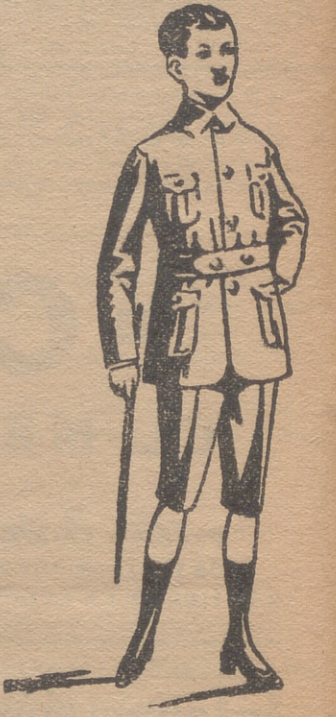
Trajecitos export y forma corriente en paño, paña y dril.

Paños, patenes y panas para encargos, á medida.