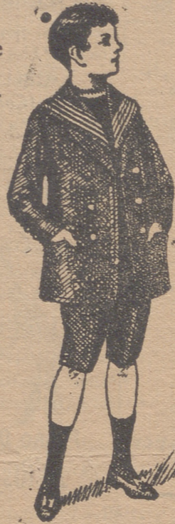
50 modelos diferentes en trajecitos de niños en dril gerga, paño, pana

Americanas azules de 5p. á 15 id. dril de 6 á 20 id. paño de 15 á 30 id. alpaca de 15 á 30 id. pana de 14 á 25