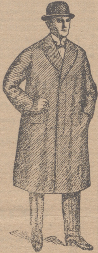
Abrigos gabardina desde 80 ptas. á 150 ptas.

Esta casa presenta siempre grandes surtidos en trajes de caballero, joven y niños y espléndido surtido en toda clase de prendas sueltas para toda clase de trajes.