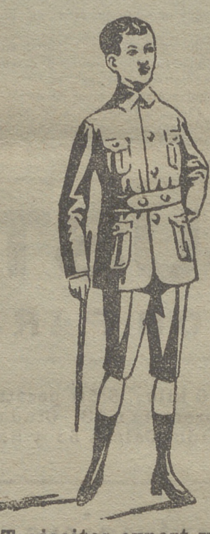
Trajecitos export y ra. forma corriente en paño, paña y dril.

En trajecitos de dril para verano se han recibido los últimos modelos de la temporada. En blanco hay bonitos modelos para la Sgda. Comunión y lazos para lo mismo.