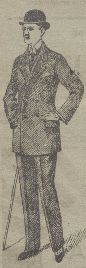
Trajes caballero de paño pana y dril

Esta casa presenta siempre grandes surtidos en trajes de caballero, joven y niños y espléndido surtido en toda clase de prendas sueltas para toda clase de trajes.