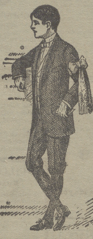
50 modelos en diferentes trajecitos de niño para primera comunión

22 modelos diferentes en abrigos de gabardina impermeabilizados. Abrigos impermeables de señora. Capitas impermeables de niños y niñas. Guardapolvos de caballero, señora y niño.