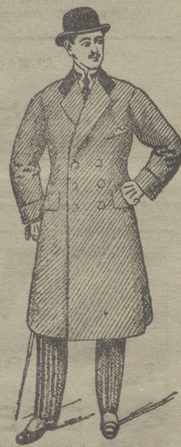
Abrigos gabardina desde 80 ptas. á 150 ptas.

Esta casa presenta siempre grandes surtidos en trajes de caballero, joven y niños y espléndido surtido en toda clase de prendas sueltas para toda clase de trajes.