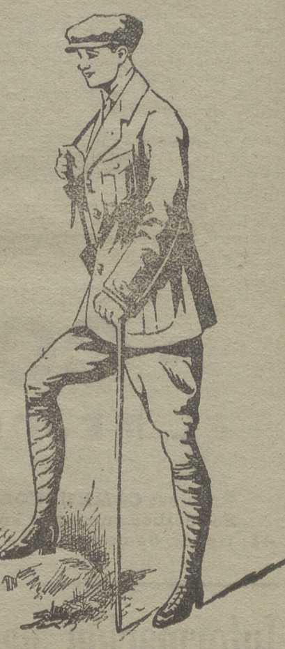
Trajes export en paño, dril y pana.

Ropa blanca de señora y niñas. Camisería, corbatería, tirantes y ligas. Grandes surtidos en lanería y pañería de caballero y señora.