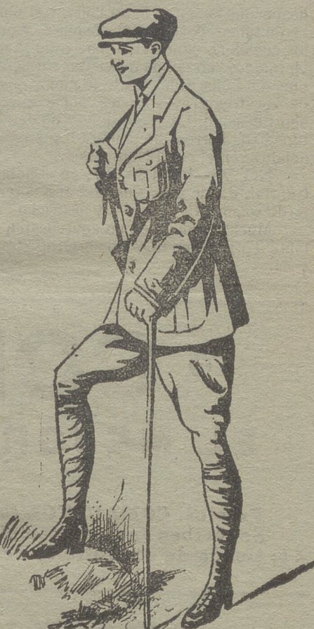
Trajes export en paño, dril y pana.

Grandes surtidos en lanería y pañería de caballero y señora.