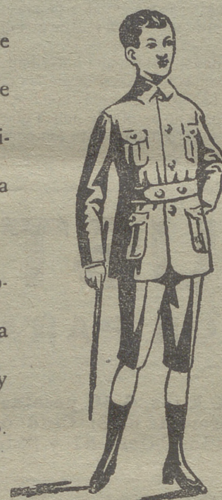
Trajecitos export y forma corriente en paño, paña y dril.

En blanco hay bonitos modelos para la Sgda. Comunión y lazos para lo mismo.