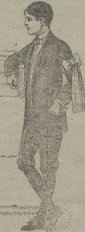
50 modelos en diferentes trajecitos de niño para primera comunión

Guardapolvos de caballero, señora y niño.