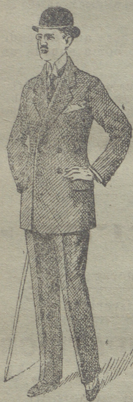
Trajes caballero de paño pana y dril

Esta casa presenta siempre grandessurtidos en trajes de caballero, joven y niños y espléndido surtido en toda clase de prendas sueltas para toda clase de trajes.