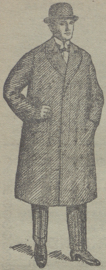
Gabanes de caballero de 30 á 125 ptas.