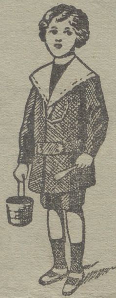
50 modelos diferentes en trajecitos de niños en paño gerga y pana.

:- Guardapolvos de caballero, señora y niños :-