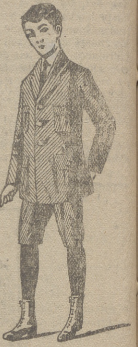
Trajes de jovencitos forma export y corriente en paño, pana y dril.

:- Grandes surtidos en camisería y corbatería :- :- Abrigos de señora desde 20 ptas. á 60 :- :- Abrigos de niña con cuello de piel desde 15 ptas. á 50 :- Capitas impermeables de niños y niñas.