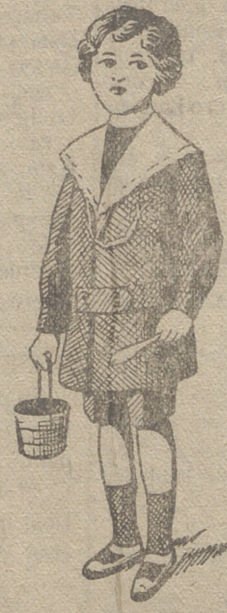
50 modelos diferentes en trajecitos de niños en paño gerga y pana.

Ultimos modelos en gabanes de caballero, jóvenes y niños :- Trajes de caballero en paño y pana :- Trajes export de paño y pana, y trajes completos azules para mecánicos y motoristas.