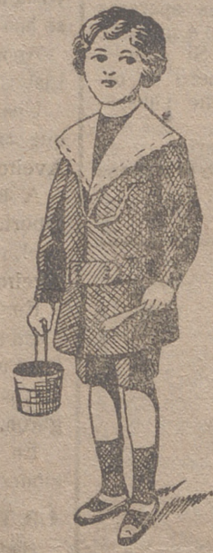
50 modelos diferentes en trajecitos de niños en paño gerga y pana.

Ultimos modelos en gabanes de caballero, jóvenes y niños :- Trajes de caballero en paño y pana :- Trajes export de paño y pana, y trajes completos azules para mecánicos y motoristas.