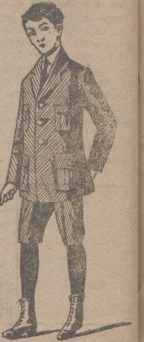
Trajes de jóvenes forma export y corriente en paño, pana y dril.

:: Grandes surtidos en camisería y corbatería :: :: Abrigos de señora desde 20 ptas. á 60 :: Abrigos de niña con cuello de piel desde 15 ptas. á 50 :: Capitas impermeables de niños y niñas.