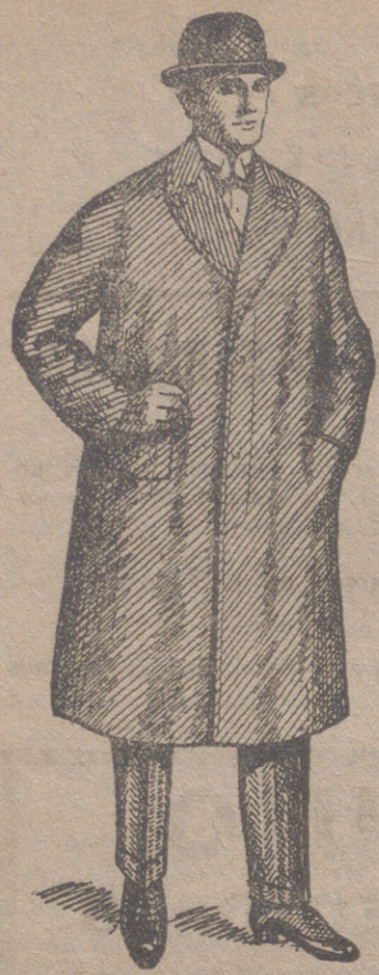
Gabanes de caballero de 30 á 125 ptas.