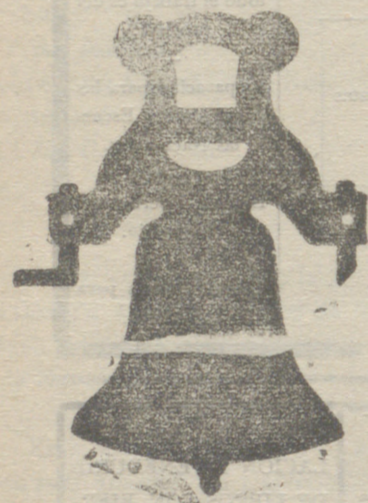
Campana con yugo de hierro de una sola pieza

Tenemos el gusto de expresar á continuación algunas de las obras realizadas en estos últimos años en Burgos y su provincia, á fin de que los que les interesa conocer esta clase de trabajos, puedan ver palpablemente la superioridad de los productos de esta casa.