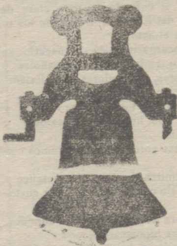
Campana con yugo de hierro de una sola pieza

Calle de Francia y Portal de Urbina VITORIA (ALAVA)