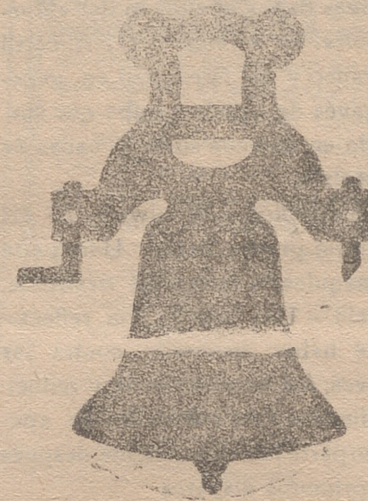
Componentes con yugo de hierro de una sola pieza.

Calle de Francia y Portal de Urbina VITORIA (ALAVA)