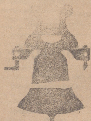
Campana con yugo de hierro de una sola pieza

Calle de Francia y Portal de Urbina VITORIA (ALAVA)