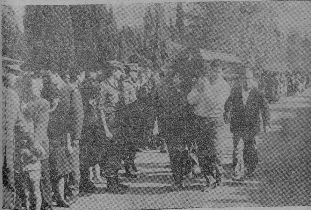
Una gran multitud asistió en Tarrasa al entierro de las víctimas ocasionadas por las inundaciones. El acto revistió un patetismo sobrecogedor.